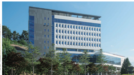
三陟校区(包括道溪)(面积633,648㎡)