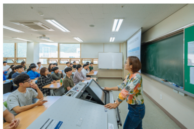
尖端教室数量/教室总数量 473/533间(89%)